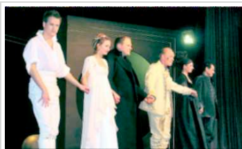
Das Ensemble der Landesbühne mit Kleiststiefgründer Komödie in Verden.

"Was seh ich? Himmel! Zwei Amphitryonen!" Jupiter hat in Gestalt des thebanischen Feldherrn Amphitryon mit dessen Gemahlin Alkmene eine sinnliche Liebesnacht verbracht. Als dieser tags darauf aus dem Krieg nach Hause kommt, muss er erfahren, dass er bereits in der letzten Nacht bei ihr war. Nicht nur Alkmene gerät über den tragischen Zweifel, ob sie mit dem richtigen Gemahl geschlafen hat oder nicht, in eine beklemmende Gefühlsverwirrung. Der Widerspruch zwischen unfehlbarem inneren Gefühl und täuschender Wirklichkeit führt zu Missverständnissen und Identitätszweifeln. Nach einer Konfrontation der beiden scheinbaren Gatten gibt sich Jupiter schließlich als Gott zu erkennen, worauf Alkmene ohnmächtig zu Boden sinkt.